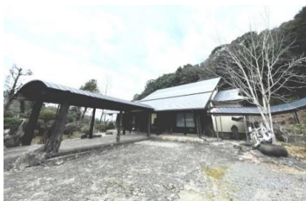
高知建機技能センター 教室所

宿泊希望者には、宿泊施設・移動手段をご紹介致します。必要であれば、お気軽にお問い合わせください。