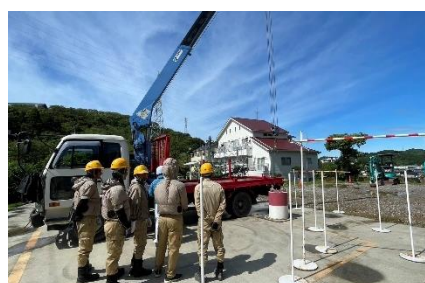
小型移動式クレーン