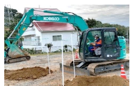
車両系建設機械(整地等)